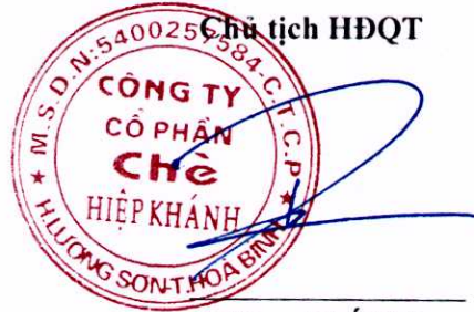
Đặng Thế Phi