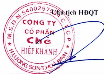
Đặng Thế Phi