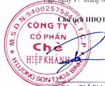
Dặng Thế Phi